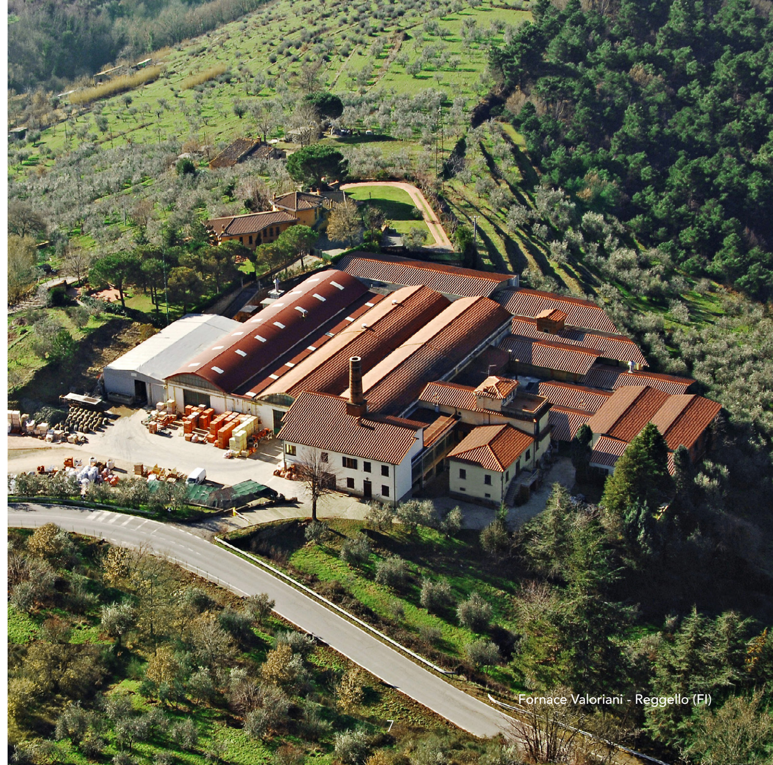
Fornace Valoriani - Reggello (FI)