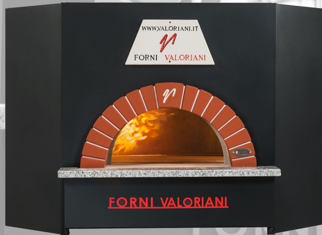
Misure espresse in cm - Measures expressed in cm

OT is a pre-assembled oven supplied complete with all upper and lower insulation and metal stand support. Available in 8 sizes, the external hexagonal steel surround and support stand are supplied in an anthracite coloured powder coated paint finish. The oven can be easily positioned on site and moved with a forklift or crane and pallet truck in accordance with the instructions we provide. OT is the ideal solution when the oven is not intended to be visible to the customer or when only the mouth will be on view. Should the dimensions of the oven not allow it to be delivered to its final position, it can be assembled on site by our technicians.